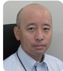
国土交通省道路局道路メンテナンス企画室長 清水 将之氏

特別講演・基調講演・パネルディスカッションへのご参加は事前登録が必要です。登録URLのフォームにご記入の上お申し込みください。2021年10月25日からお申し込みを受け付けます。